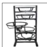
USH 4 + Rack de Mangueiras