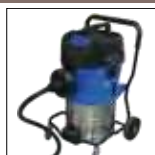
UVC Dispositivo Sucção