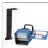
UMS 4 + 514.1 Dispositivo medição