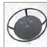
513.1 Suporte para USH 4