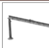
UHG 14 + UHG14 Régua de corte