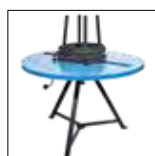
UAT 4 Mesa Enroladora