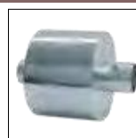
330.1 Apagador de Faísca